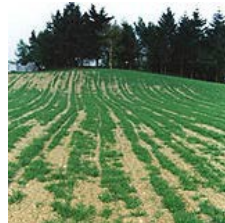
wassergesättigtem oder ausgetrocknetem Boden

Vorsicht ist zudem geboten bei Hofdüngeraustragung während oder kurz vor starken Regenfällen sowie entlang von Gewässern ab dem Pufferstreifen.